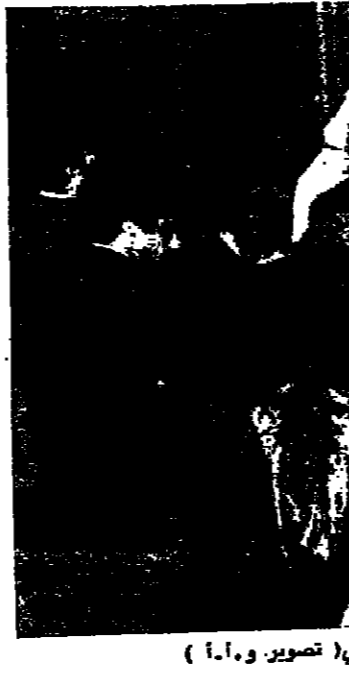
وفد الاتحاد القسالي الديمقراطي العالمي يتحدث في مؤتمره الصحفي

مونتيري (ولاية ايلاما) - رويتر - قال اطباء هنا ان العملية الجراحية التي اجريت للممر لوريسين والاس حاكمة ولاية ايلاما ازال كل السرطان للسرطان ويستكين الممر والاس من العودة الى مزاوله اعماله خلال شهر . وكانت الممر والاس وهي مصابة بسرطان منذ سنة ١٩٦٠ . قد اجريت لها عملية جراحية هي الثالثة بسرم الخيوس المائي لاستئصال ورم نسي تجويف الحوض .